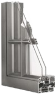
▲ RECTO 80 Stratolo