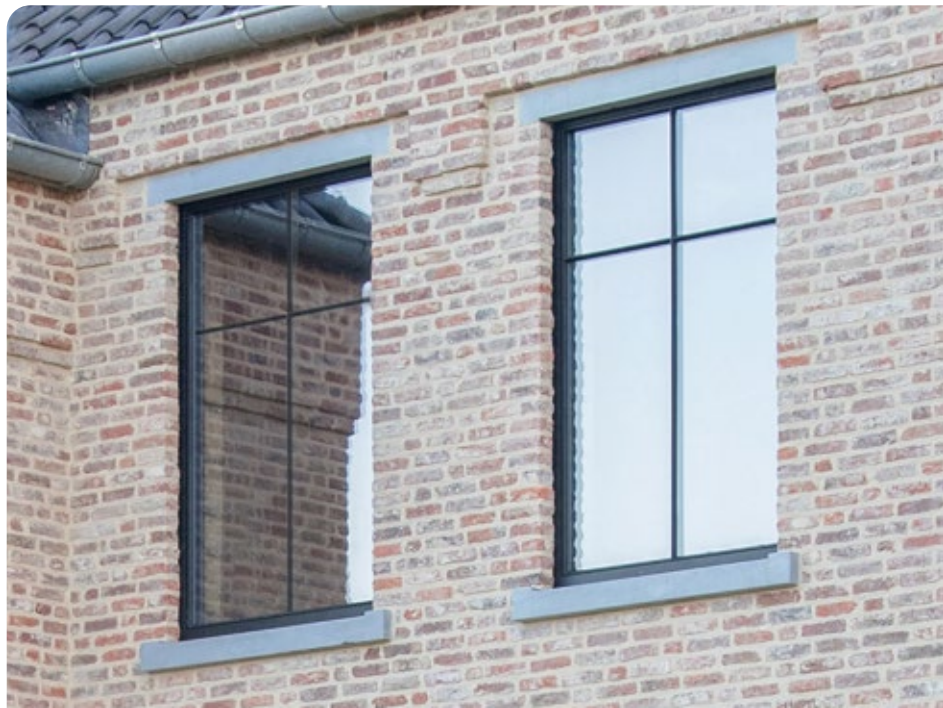
▼ RECTO 80 Stratolo