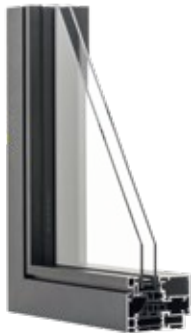
▲ RECTO 80 Finolo