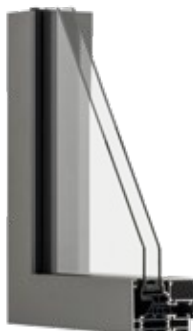
▲ RECTO 80 Inviso