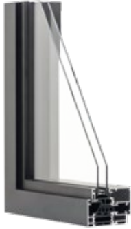
▲ RECTO 80 Primolo